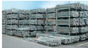
Stapelgestell auch mit zwei Mittelstreben erhältlich