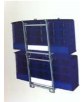
stapelbare und kranfähige Paletten