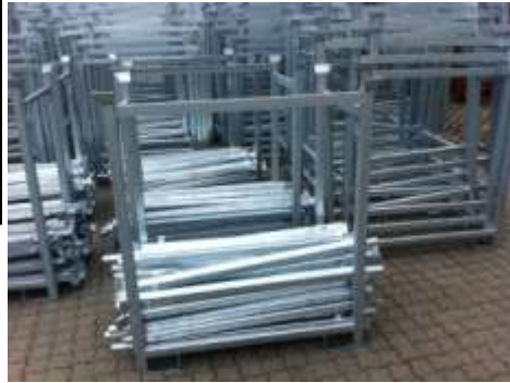
Abnehmbare Frontpfosten ermöglichen ein leichtes Entnehmen der stehenden Gitter