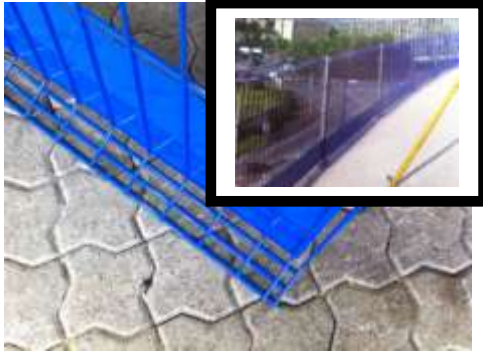
vorgeschriebenes Bord- / Fußblech integriert